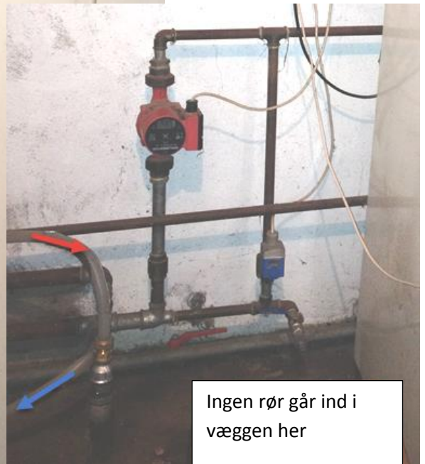
Ingen rør går ind i væggen her